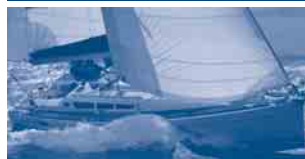
Sun Odyssey 42i