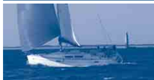
Sun Odyssey 39i Performance