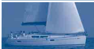
Sun Odyssey 39i