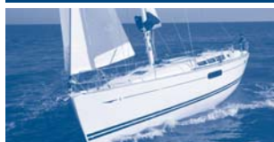
Sun Odyssey 44i Performance