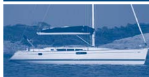
Sun Odyssey 49i