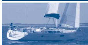
Sun Odyssey 44i