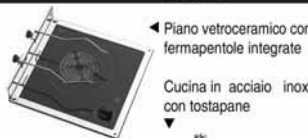
◀ Piano vetroceramico con fermapentole integrate