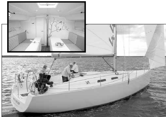
Il Varianta 44 (13,33 m) della Hanse è una nuova barca che punta sull'essenziale.

ce. L'albero, però, è un solido Sparcraft, la ruota del timone imponente (180 cm), ci sono quattro winch, il motore è un Volvo Sail-drive da 40 hp e sotto la chiglia c'è un bel bulbo a "T".