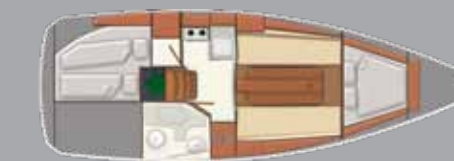
Interieur 2 Kabinen innenbord Motor