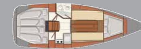
Interieur 3 Kabinen außenbord Motor