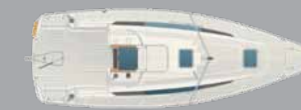
Deckplan mit Pinnensteuerun