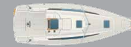
Deckplan mit Steuerrad