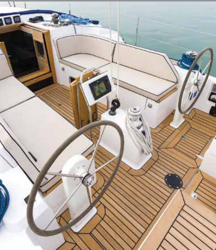
SOLO: Testbåten har «shorthand» cockpit. Storseilskjøtet går direkte til en sentral vinsj. Griperekke på rattpidestallen savnes. Likeså lister til foten for rormannen.

Til babord i salongen er det en stor u-sofa. Salongbordet kan vippes over slik at størrelsen dobles. Under salongbordet er det lagringsplass til noen blader, eller en iPad.