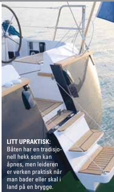
LITT UPRAKTISK: Båten har en tradisjonell hekk som kan åpnes, men leideren er verken praktisk når man bader eller skal i land på en brygge.

Akterlugarene har litt smale køyer. Mellom køyene er det et teknisk rom hvor det er plass til generator eller annet utstyr. På oppdaterte tegninger er det tekniske rommet krympet, og køyene er gjort