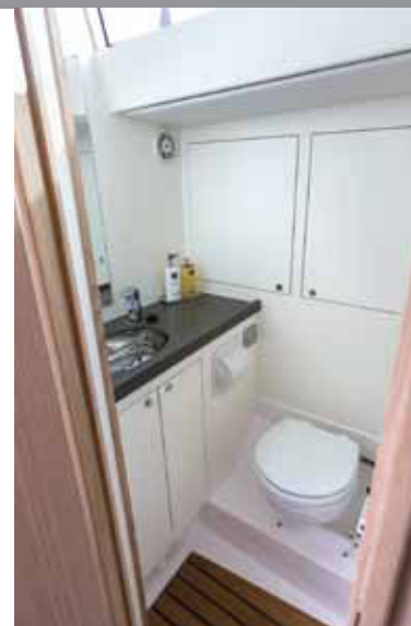
BAD: Contest 42 CS har et stort og elegant bad, men det mangler luker som kan åpnes. Dette er det aktre badet som er ekstra stort på denne modellen.