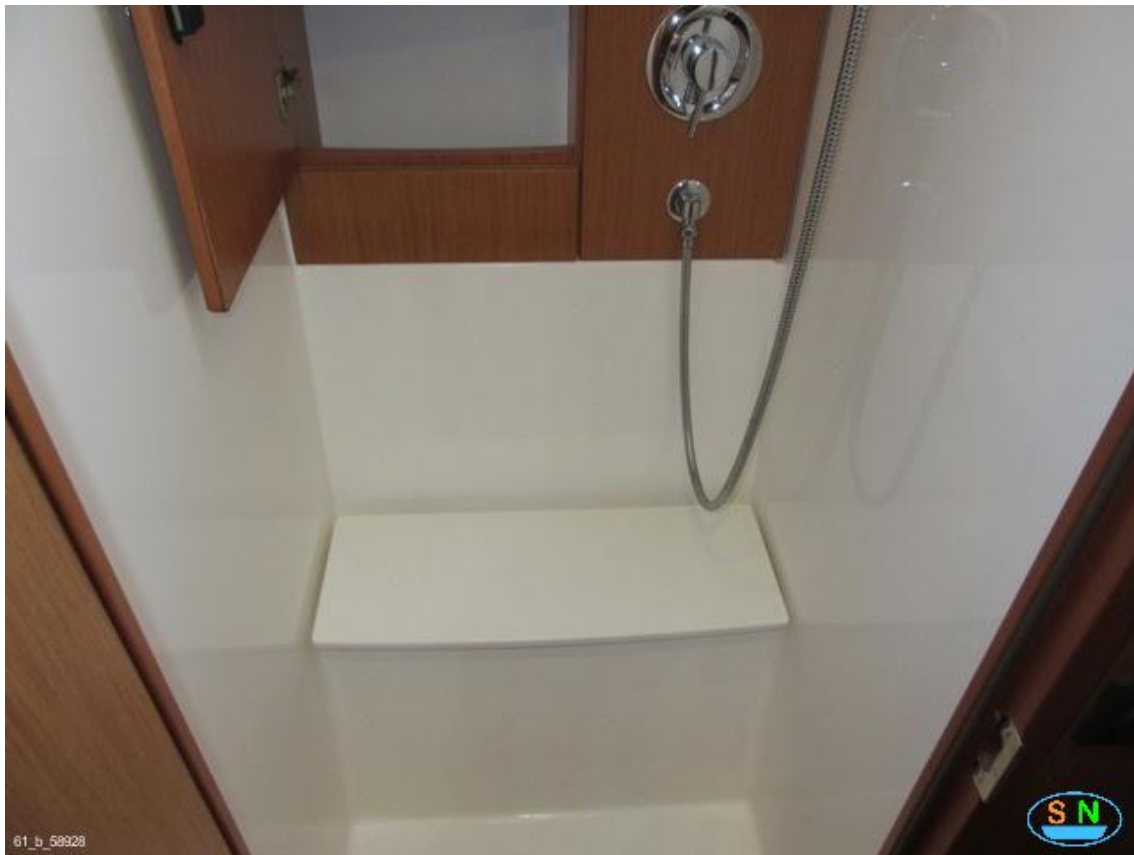
Layout / Bavaria Cruiser 46 - 2014