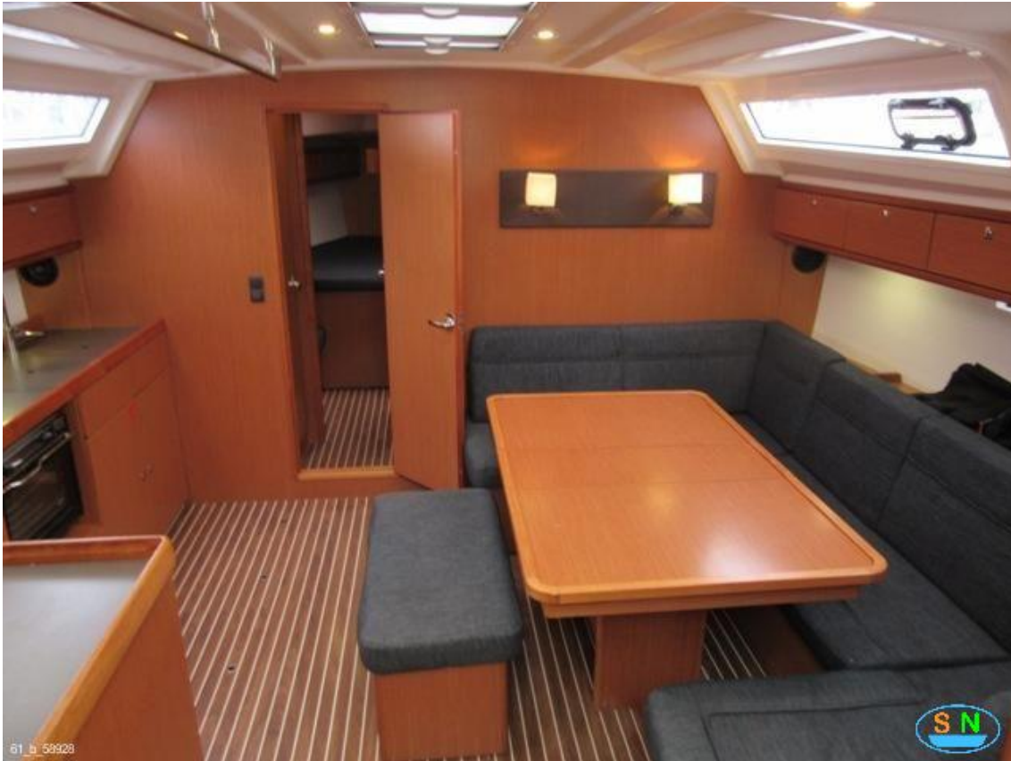
Salon / Bavaria Cruiser 46 - 2014