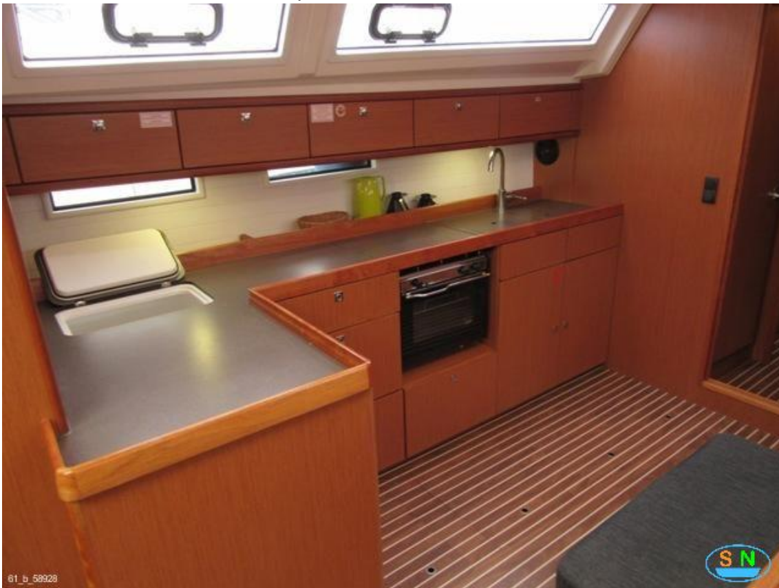
Cabin / Bavaria Cruiser 46 - 2014