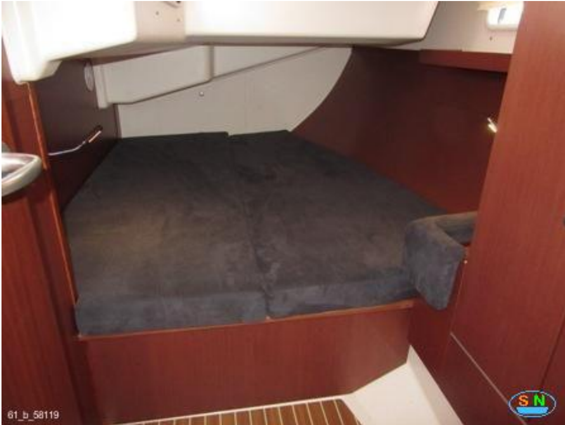
Cabin / Hanse 415 - 2016