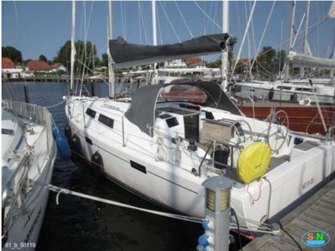
Cockpit / Hanse 415 - 2016