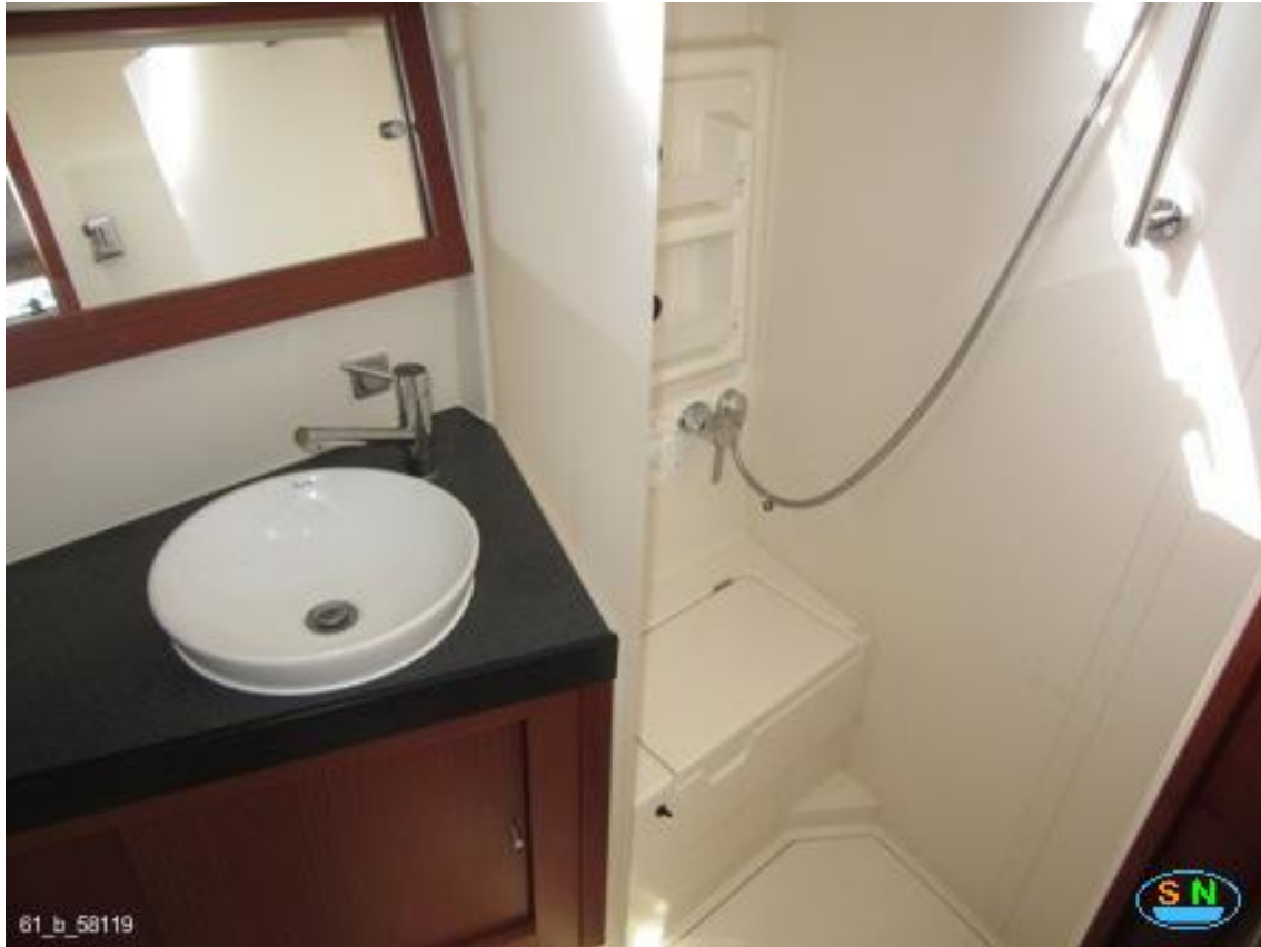
Layout / Hanse 415 - 2016