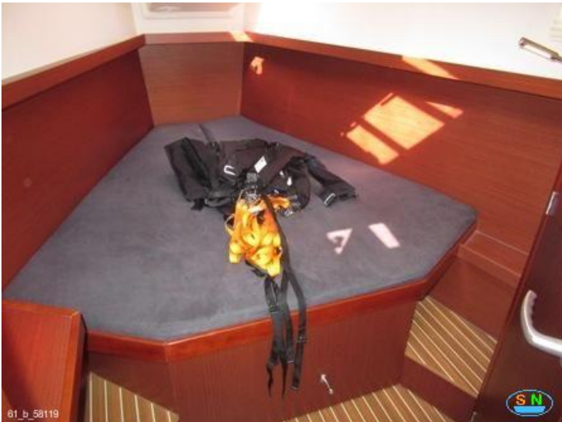
Cabin / Hanse 415 - 2016