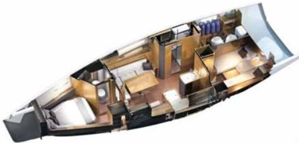
2-cabin version B