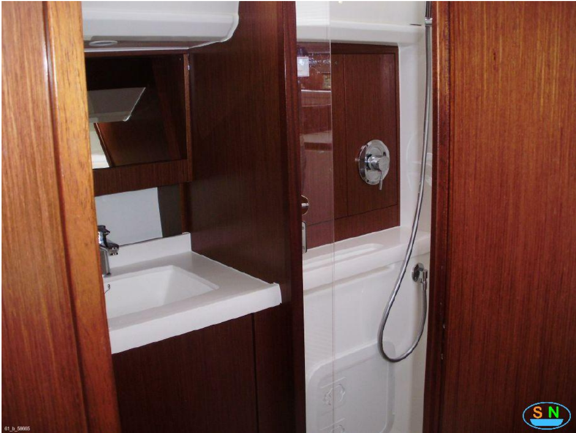
Layout / Bavaria Vision 42 - 2017